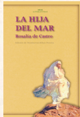
La Hija del mar