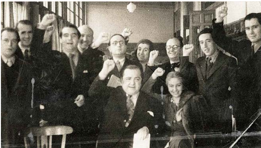
La generación del 27

Un dato curioso muy destacado es que, a pesar de que mostraba interés por la literatura, los premios y reconocimientos en su juventud se debían a su entrenamiento deportivo.