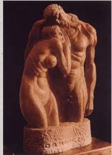
Adán y Eva 1930

Influyó significativamente en Antoine de Saint-Exupéry, quien se inspiró en sus ilustraciones para El Principito.