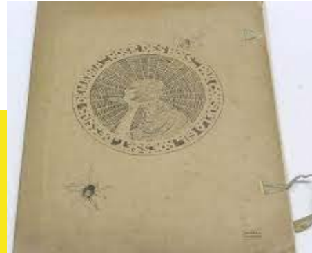
Rose de Bois